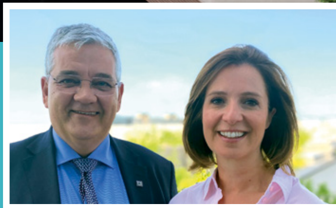
Steven Vandeput burgemeester

Hasselt is een aantrekkelijke en smaakvolle stad. Ze nodigt uit voor een bezoek en brengt mensen samen. Daarom zetten we sterk in op de modernisering van onze straten en pleinen, zowel bovengronds als ondergronds. Kwaliteit en comfort plaatsen we daarbij voorop. Zo blijft onze binnenstad een buitengewone plek om te wonen, werken en winkelen.